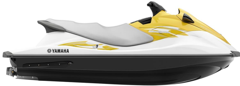
Pure White with Laser Yellow Metallic